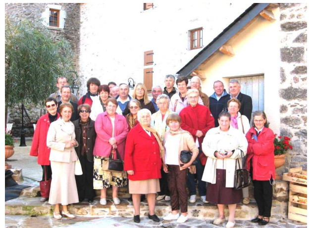
Une partie de l'équipe bénévole dans la cour du Château de Nages.

Toutes les bonnes volontés sont invitées à venir étoffer les bancs de cette équipe dévouée et engagée !!